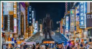
ถนนแดนเดินเขาวงซิงคู่