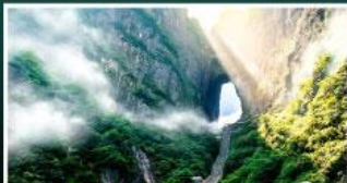
เขาประตูลสวรรค์