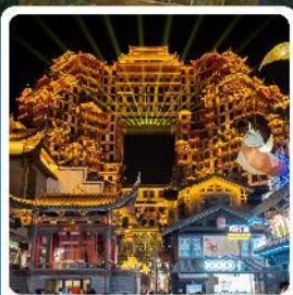
ตึกหอคจรรย 72