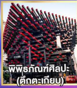
พิพิธภัณฑ์ศิลปะ (ตึกตะเกียบ)