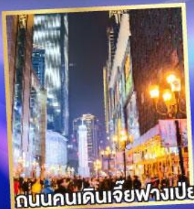
ถนนคนเดินเจียฟางเป่ย์