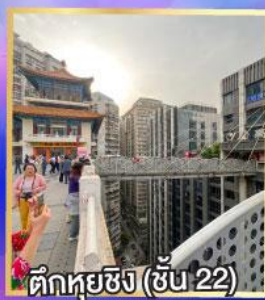
ตึกหุ่ยซิง (ชั้น 22)