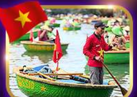
เรือกระด้ง หมู่บ้านก๊อบกาน