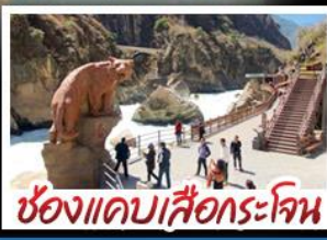
ช่องแคบเสือกะโจน