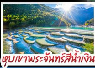
เขตก้อนหินสีน้ำเงิน