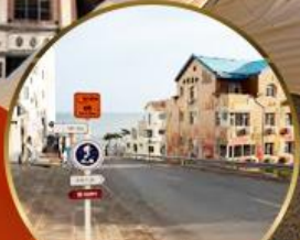
ถนนอ่าวจีป่า