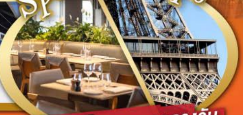
รับประทานอาหารกลางวัน บนหอคอยเฟลา