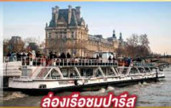
ล่องเรือชมปารีส