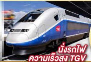
นั่งรถไฟ ความเร็วสูง TGV