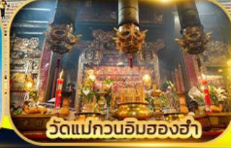
วัดแม่กวนอิมฮ่องฮ่า