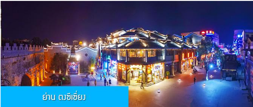
ย่าน ตงซีเจียง

จากนั้นนำท่านเที่ยวชม พิพิธภัณฑ์ดอกกุยฮวา 桂花公社 ดอกกุยฮวาเป็นดอกไม้สีเหลืองที่มีกลิ่นหอม เป็นดอกไม้ประจำเมืองของกุยหลิน จะเบ่งบานในช่วงเดือนมิถุนายน – กรกฎาคมของทุกปี ในช่วงที่ดอกกุยฮวาเบ่งบานในเมืองกุยหลินจะคลุ้งไปด้วยกลิ่นหอมจากดอกกุยฮวา ทั่วเมืองกุยหลินจะเต็มไปด้วยสีเหลืองของดอกกุยฮวา ดอกกุยฮวาสามารถนำมาแปรรูปเป็นอาหารและเครื่องดื่มได้ และได้รับความนิยมจากชาวจีนตอนใต้เป็นอย่างมาก ชมพิพิธภัณฑ์ที่ทันสมัยด้วยระบบจัดแสดงที่ทันสมัย ภายในพิพิธภัณฑ์มีความโอ้อ่า มีการสาธิตและจำหน่ายผลิตภัณฑ์ที่ทำจากดอกกุยฮวา อาทิ ขนมดอกกุยฮวา ชาที่ทำจากดอกกุยฮวา และสินค้าพื้นเมืองอื่น ๆ