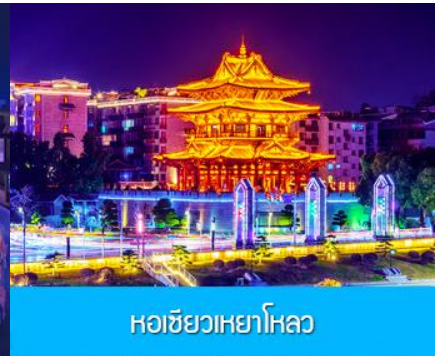
หอชิวเหยาไหล