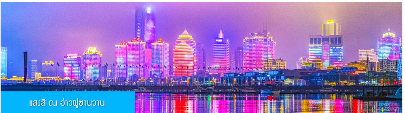
แอสสิ ณ อ่าวฟู่ซานวาว

ค่ำ รับประทานอาหารค่ำ ณ ภัตตาคาร *เมนูซีฟู้ด (3)