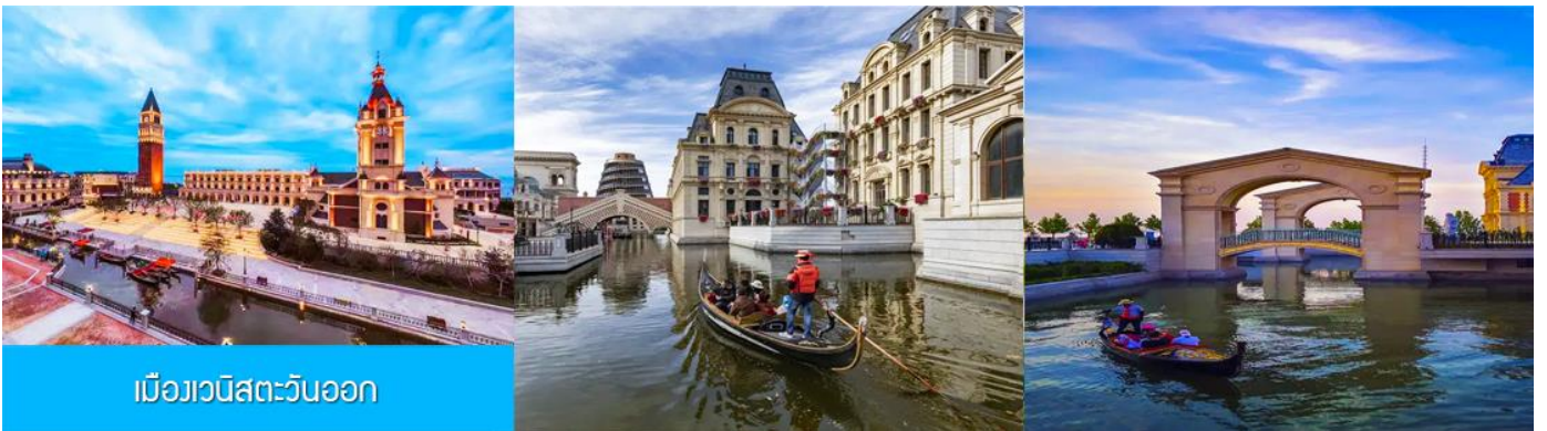
เมืองเวนิสตะวันออก

จากนั้นนำท่านเที่ยวชม เมืองเวนิสตะวันออก 大连东方威尼斯城 เป็นเมืองเวนิสจำลองที่ถูกสร้างขึ้นด้วยทุนกว่า 8,000 ล้านบาท ออกแบบโดยบริษัท ARC จากประเทศฝรั่งเศส โดยจำลองผังเมืองเวนิสในประเทศอิตาลี