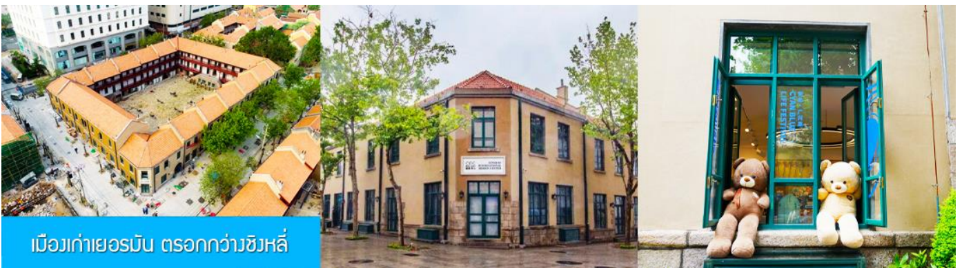
เมืองเก่าเยอรมัน ตรอกกว้างชิงหลี