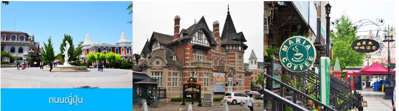
ถนนญี่ปุ่น