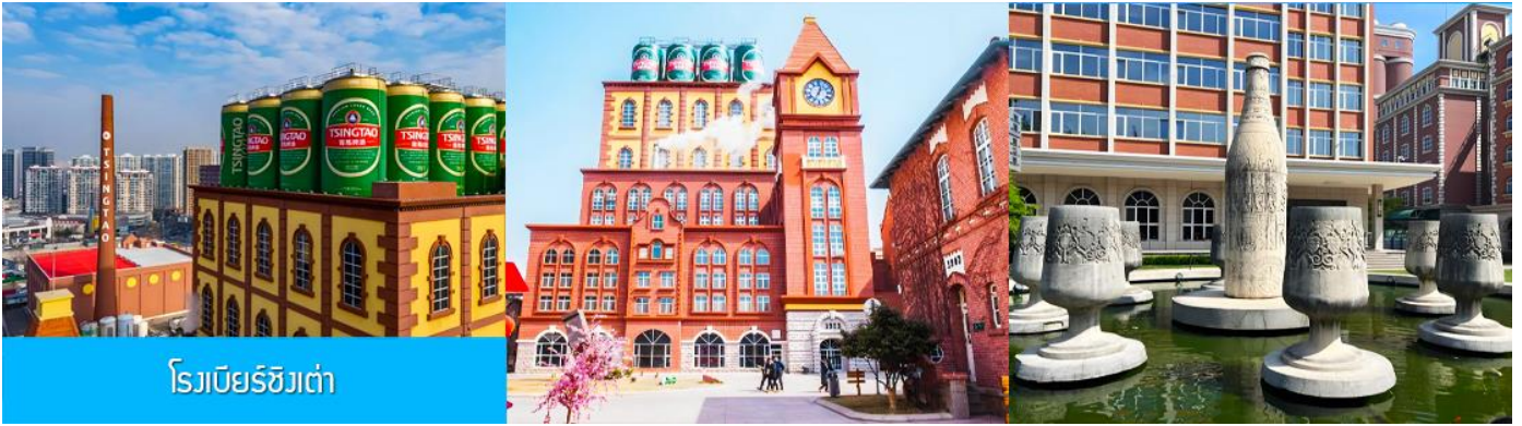
โรงเบียร์ชิงเต่า

จากนั้นนำท่านเที่ยวชม โรงเบียร์ชิงเต่า 青岛啤酒博物馆 พิพิธภัณฑ์เบียร์ที่ขึ้นชื่อของเมืองชิงเต่า ซึ่งเป็นเบียร์ยี่ห้อแรกที่ผลิตขึ้นในประเทศจีน ชมเบียร์ คอลเลกชั่นที่มียี่ห้อหลากหลายที่สุดของโลก และชมการจัดแสดงภาพและวิทัศน์เกี่ยวกับวิวัฒนาการของเบียร์ ขั้นตอนการผลิตและอื่น ๆ ที่เกี่ยวข้อง พร้อมชิมเบียร์ชิงเต่า ซึ่งเป็นเบียร์ที่ขายดีที่สุดในยี่ห้อหนึ่งของจีน.. (ชิมเบียร์ชิงเต่าท่านละ 1 แก้ว รับกลับอีก 1 ขวดเล็ก ตอนเดินออก)