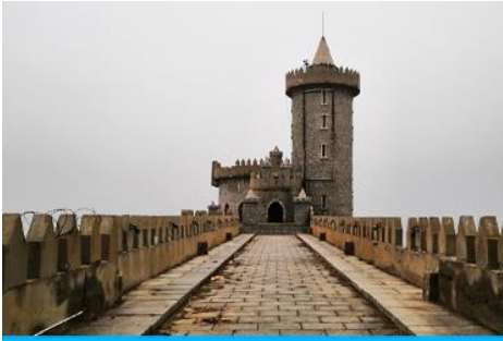
คาเฟ่อีสดง