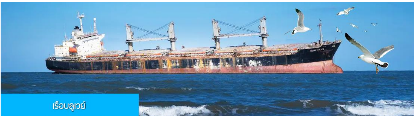
เรือบลูเวย์

เที่ยง รับประทานอาหารกลางวัน ณ ภัตตาคาร (5)