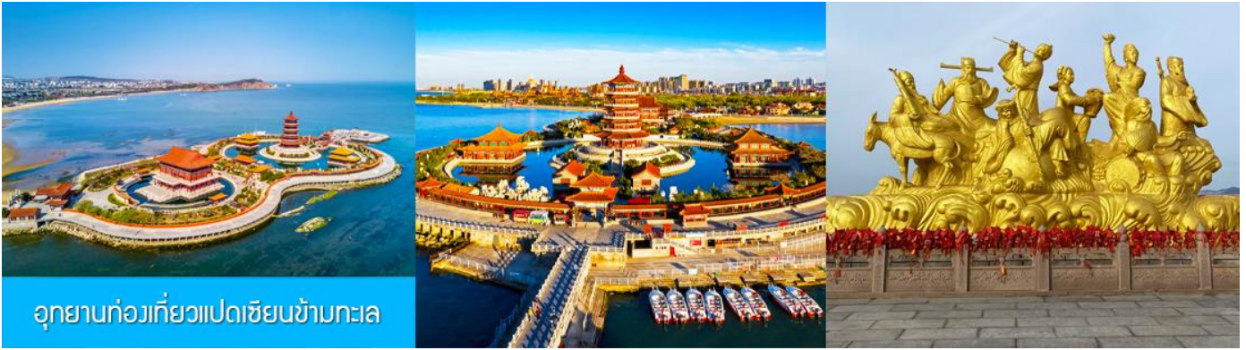
อุทยานท่องเที่ยวแปดเซียนข้ามทะเล