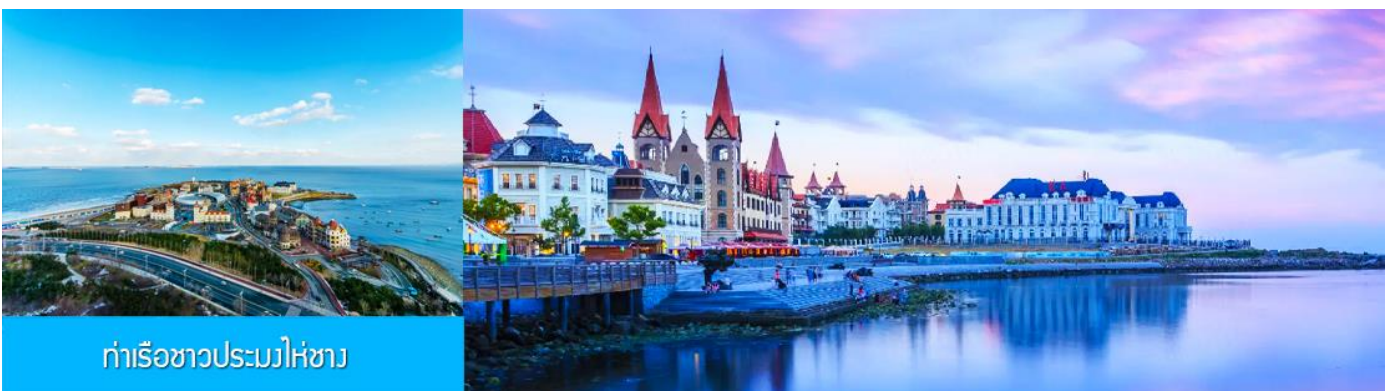
ท่าเรือชาวประมงไห่ซาง