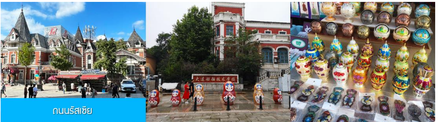
ถนนรัสเซีย

จากนั้นนำท่านขึ้น รถรางไฟฟ้า 有轨电车 เป็นรถรางไฟฟ้าที่สร้างขึ้นในปี ค.ศ. 1909 โดยบริษัทญี่ปุ่น (เมืองต้าเหลียนเคยตกเป็นเมืองขึ้นของญี่ปุ่นในปีค.ศ. 1900 – 1945 ) นำท่านนั่งรถรางโบราณผ่านชมตัวเมืองต้าเหลียน หนึ่งในเมืองแรก ๆ ที่มีบริการรถรางไฟฟ้าเปิดให้บริการในเขตเมือง ปัจจุบันมีเพียงสายที่ยังเปิดให้บริการในเมืองต้าเหลียน.