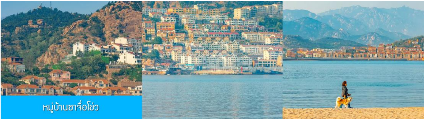
หมู่บ้านซาจื่อโข่ว

เช้า รับประทานอาหารเช้า ณ ห้องอาหารของโรงแรม (4)