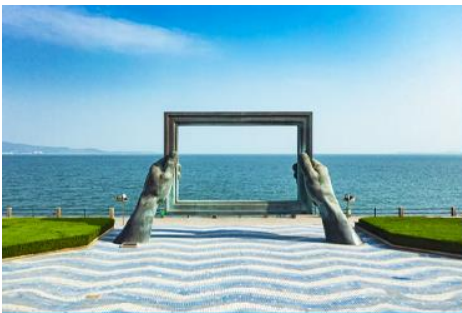
กรอบรูปวิวทะเล

เช้า รับประทานอาหารเช้า ณ ห้องอาหารของโรงแรม (7)