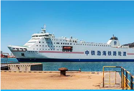
เรือ ZHONGTIE BOHAI CRUISE

เมื่อเวลาแก่เวลา นำท่านขึ้นเรือ ZHONGTIE BOHAI CRUISE เพื่อเดินทางสู่เมืองต้าเหลียน