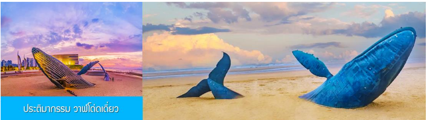
ประติมากรรม วาฬโดดเดี่ยว

จากนั้นนำท่านเดินทางสู่ เมืองเยียนไถ 烟台 (ระยะทาง 85 กม. ใช้เวลาเดินทางราว 1 ชั่วโมงเศษ)