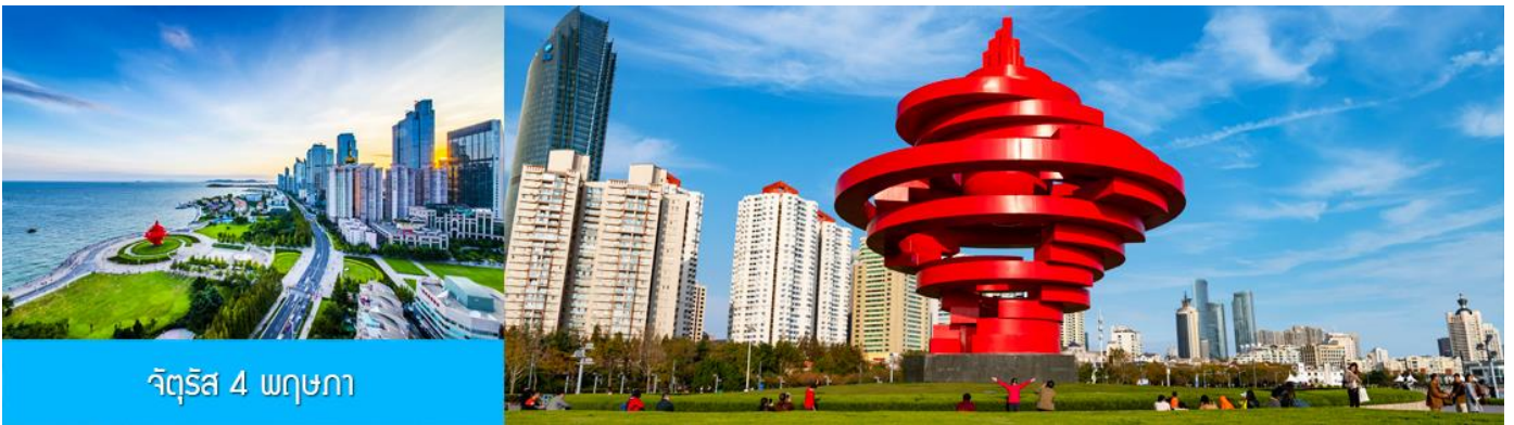
จัตุรัส 4 พฤษภาคม

จากนั้นนำท่านเที่ยวชม โรงเบียร์ชิงเต่า 青岛啤酒博物馆 พิพิธภัณฑ์เบียร์ที่ขึ้นชื่อของเมืองชิงเต่า ซึ่งเป็นเบียร์ยี่ห้อแรกที่ผลิตขึ้นในประเทศจีน ชมเบียร์ คอลเลกชั่นที่มียี่ห้อหลากหลายที่สุดของโลก และชมการจัดแสดงภาพและวิทัศน์เกี่ยวกับวิวัฒนาการของเบียร์ ขั้นตอนการผลิตและอื่น ๆ ที่เกี่ยวข้อง พร้อมชิมเบียร์ชิงเต่า ซึ่งเป็นเบียร์ที่ขายดีที่สุดในยี่ห้อหนึ่งของจีน.. (ชิมเบียร์ชิงเต่าท่านละ 1 แก้ว รับกลับอีก 1 ขวดเล็ก ตอนเดินออก)