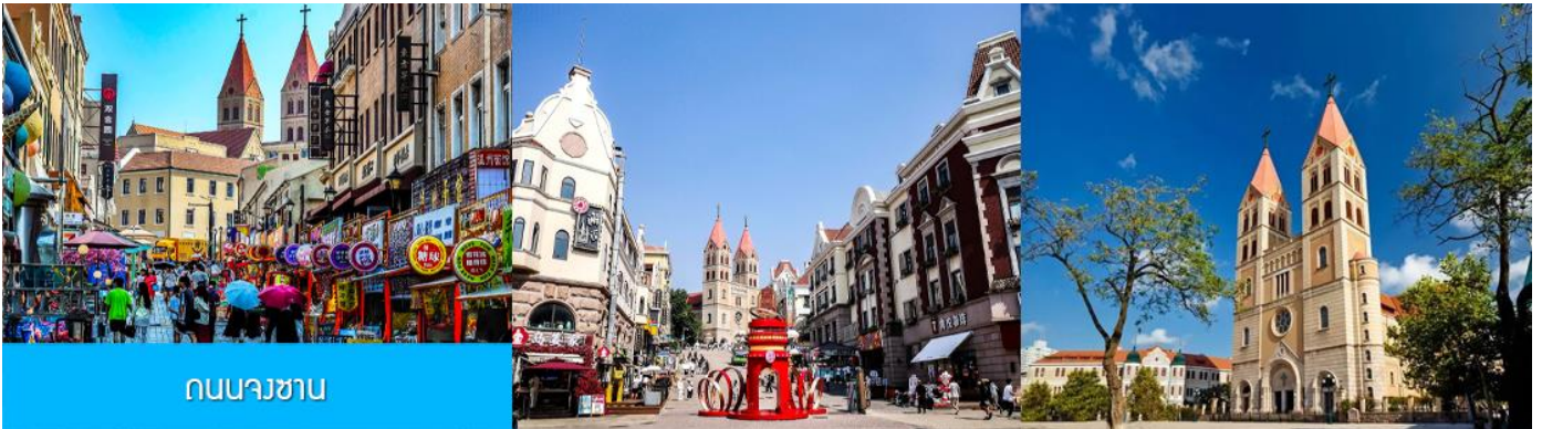
ถนนางซาน