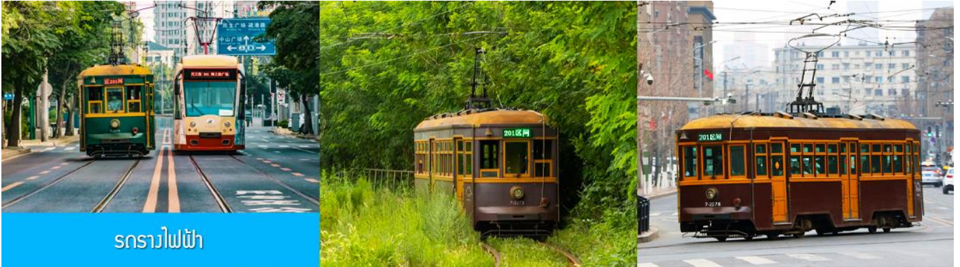
รถรางไฟฟ้า