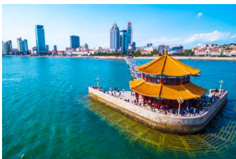
สะพานเจี้ยนเฉียว