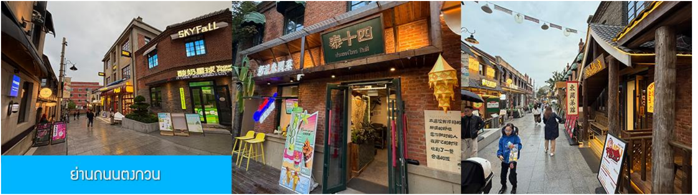
ย่านถนนตวงกวน