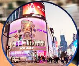
ถนนหนานจิง