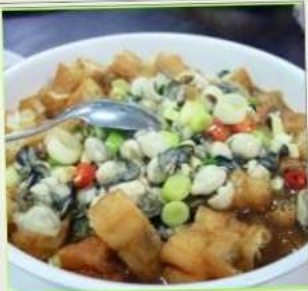
ถนนโบราณสี้อเฟิ่น