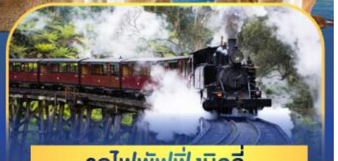
รถไฟพuffingบิลลี่

ล่องเรือชมอ่าวซิดนีย์พร้อมรับประทานอาหารกลางวัน และ เข้าชมสวนสัตว์การองก้า