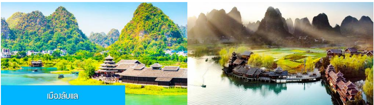
เมืองลับแล

พักที่ YANGSHUO ELITE GARDEN HOTEL ระดับ 4 ดาว ท้องถิ่นหรือเทียบเท่าใน เมืองหยางชว่