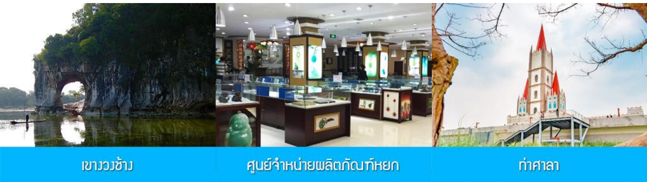
เขาวงว้าง

พักที่ GUILIN VIENNA HOTEL โรงแรมระดับ 4 ดาวท้องถิ่น หรือเทียบเท่าในเมืองกุ้ยหลิน