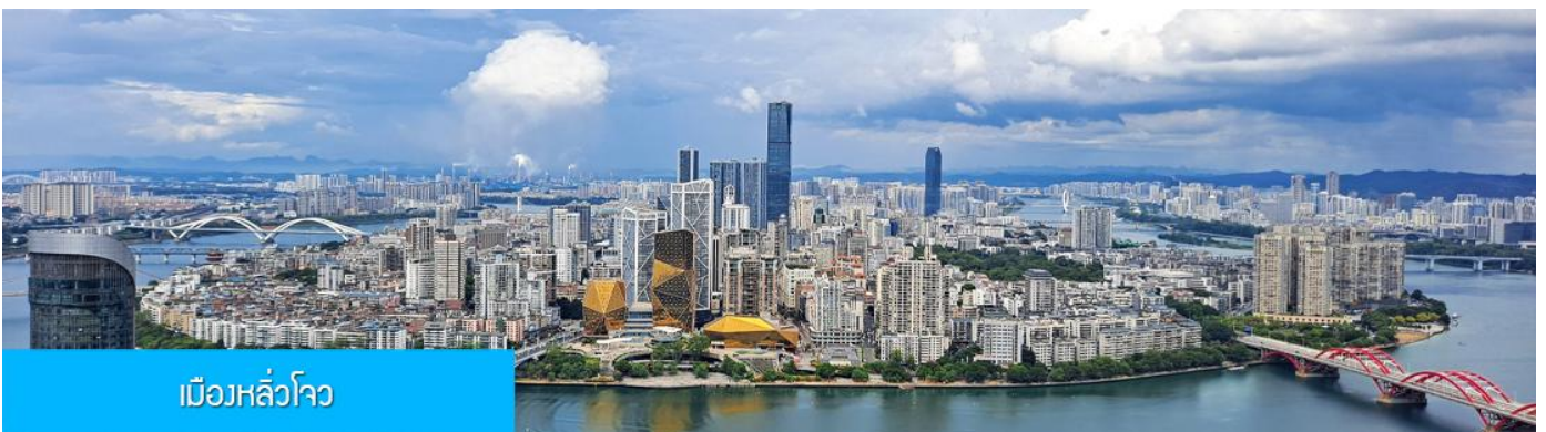
เมืองหลิวโจว

เช้า รับประทานอาหารเช้า ณ ห้องอาหารของโรงแรม (1)