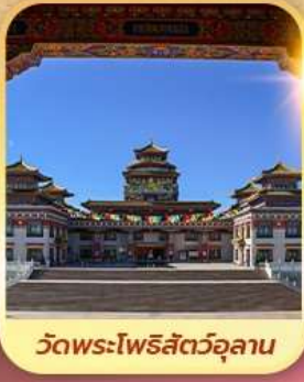
วัดพระโพธิสัตว์อุลาน