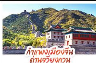
กำแพงเมืองจีน ด้านจวิ้นกวน

ส่องเรือสุดโรแมนติกแม่น้ำหวงผู้ ปักกิ่ง..เปิดประตูสู่แดนมังกร ด้วยความอลังการระดับจักรพรรดิ ชิงเต่า..เมืองชายทะเลสไตล์ยุโรป หูรหราบแบบผ่อนคลาย เซี่ยงไฮ้..มหานครแห่งเอเชีย เมืองที่ไม่เคยหลับใหล