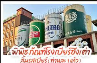
พิพิธภัณฑ์โรงเบียร์ชิงเต่า คิมรสเบียร์ (ท่าคณะ 1 แก้ว)