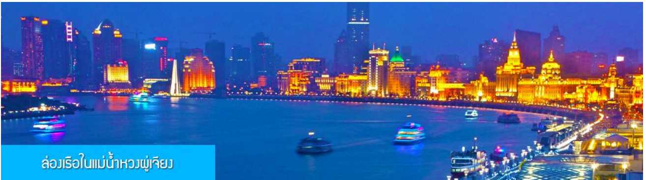
ล่องเรือใบแม่น้ำหวงผู้เจียง