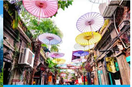
ย่านเกียบจิวฟา