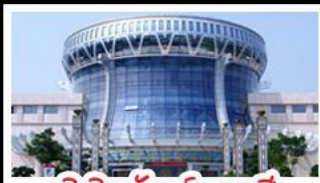
พิพิธภัณฑ์กังวานสี

สวนสนุก FANTASYLAND - หมู่บ้านสไตล์ยุโรป พิพิธภัณฑ์กังวานสี - ถนนคนเดินสามตรอกสองซอย ท่าเรือกิ่งจื่อ - ศาลเจ้าแม่กวนอิมพันกร เมนูพิเศษ อาหารกังวานตุ้ง , สุกีชาบูหม่าล่า