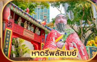
หาดร์พลัสเบย์