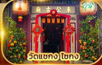
วัดเขangkง ไชกง