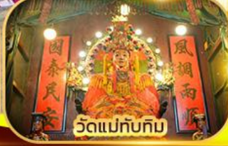
วัดแม่ทับทิม