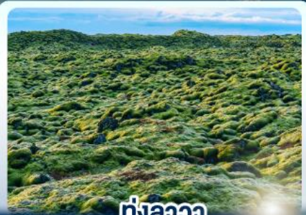
♨️ ทุ่งลาวา