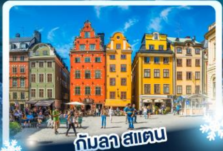
♨️ กับลาสแตน