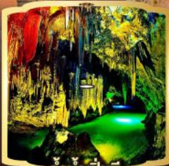
ถ้ำน้ำเป็นซี