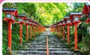
ศาลเจ้าคิฟูเนะ