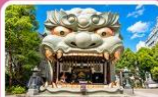
ศาลเจ้านิมมะ ยาชากะ