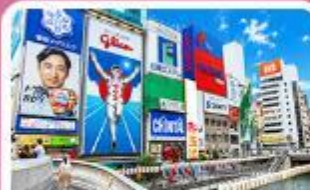
ชิบโซบาชิ