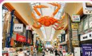
ตลาดคูโรมง