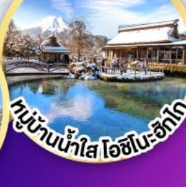
หมู่บ้านน้ำใส ไอชิโมะ-ซึกาโ