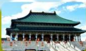
พระราชวังจำลองต้ามออร์ดอส