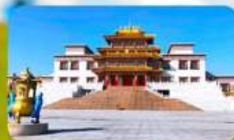
คฤหาสน์พุทธบูชาแห่งชีวีคูลาน