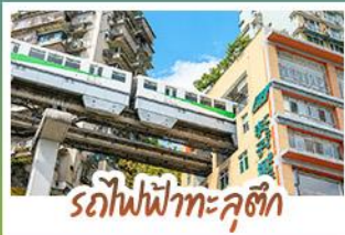
รถไฟฟ้าทะเลสาบสี่ดรุณี

ชมธรรมชาติ ณ อุหลง ชมหุบเขาสุดอลังการระดับมรดกโลก นั่งรถไฟฟ้าทะเลสาบสี่ดรุณี สัมผัสกลิ่นเหมืองทองซึ่งสุดล้ำ สัมผัสวิถีภูเขาหิมะแห่ง ภูเขาสี่ดรุณี งดงามจนได้รับฉายา "เทือกเขาแอลป์แห่งตะวันออก" ชมธรรมชาติสุดฟิน ณ อุทยานปี่ฝิ่งโกว • ซ้อปิ้งจุใจ ถนนคนเดินไท่กู่หลี่, ถนนคนเดินซุนชู่