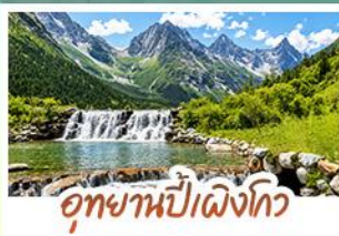
อุทยานปี่ฝิ่งโกว