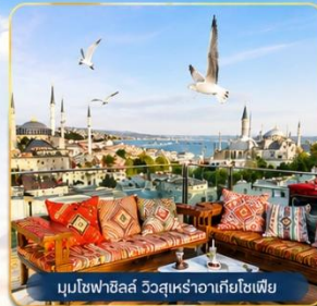
มุขโหลยาลิส วิวสุเหร่าฮาเกียโซเฟีย

ช่องแคบบอสฟอรัส • สุเหร่าสีน้ำเงิน • สุเหร่าฮาเกียโซเฟีย