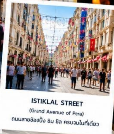
ISTIKLAL STREET (Grand Avenue of Pera) ถนนสายช้อปปิ้ง อิม บิล ครบจบในที่เดียว