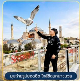
มุขถ่ายรูปลยออดิต โกลิฮัดนทงนงวอล