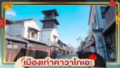
เมืองท่าคาวาโกเอะ