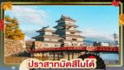
ปราสาทมิดสึโมโด้