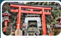
ศาลเจ้าอินะซิมะ