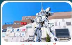
ห้างไดเวอร์ซิตี