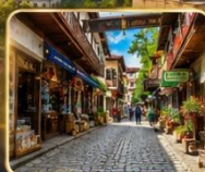
เดินเล่นย่านเมืองเก่าบรรยากาศย้อนยุค