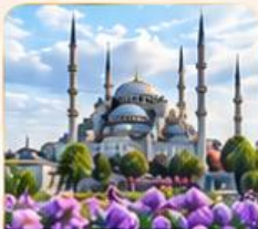
BLUE MOSQUE สุเหร่าสีน้ำเงิน