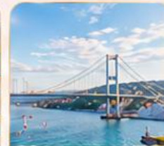
BOSPHORUS STRAIT ช่องแคบบอสฟอรัส