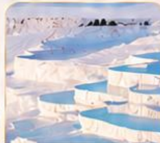
PAMUKKALE ปานุกคาล่า