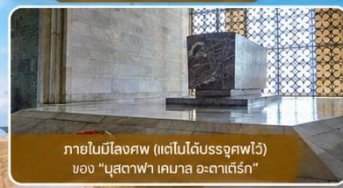
ภายในมีโลงศพ (แต่ไม่ได้รับอนุญาตให้เข้า) ของ "มุสตาฟา เคมาล อะตาเติร์ก"