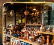
เลือกซื้อของฝากงานหัตถกรรมพื้นเมือง

สัมผัสเสน่ห์แห่งอดีตในเมืองที่เวลาเดินช้าลง กับสถาปัตยกรรมอันงดงาม วัฒนธรรมที่ยังคงมีชีวิต และความอบอุ่นจากผู้คน