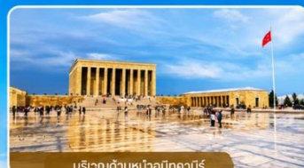
บริเวณด้านหน้าอนิตคาบิร์

สถานที่สำคัญที่คนตุรกีให้ความเคารพและจดจำผู้นำผู้ยิ่งใหญ่ ที่อุทิศทั้งชีวิตเพื่อชาติ ศาสนา และประชาชน