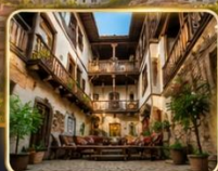
บ้านเรือนสไตล์ออตโตมันอายุกว่า 200 ปี

เมืองท่องเที่ยวที่มีชื่อเสียงของจังหวัดการาบิค (Karabük) ในปี 1994 เมืองซาฟรานโบลู ได้ถูกองค์การยูเนสโกยกให้เป็น มรดกโลกทางด้านวัฒนธรรม