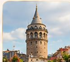
GALATA TOWER หอคอยกาลาตา