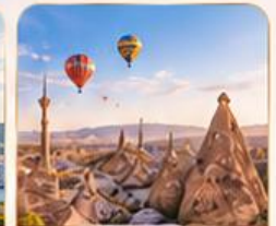
CAPPADOCIA คัปปาโดเกีย