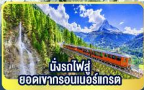
นั่งรถไฟสู่ ยอดเขารอนเนอร์เกรต