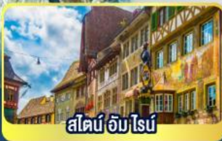
สไตน์ อัม ไรบ์