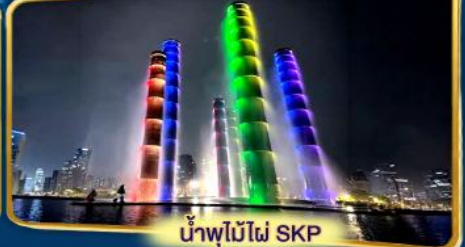
น้ำพุไม้ไผ่ SKP