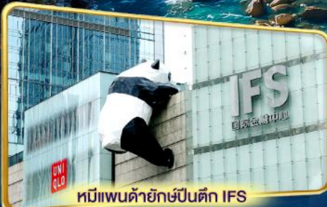
หมีแพนด้ายักษ์ปีนตึก IFS