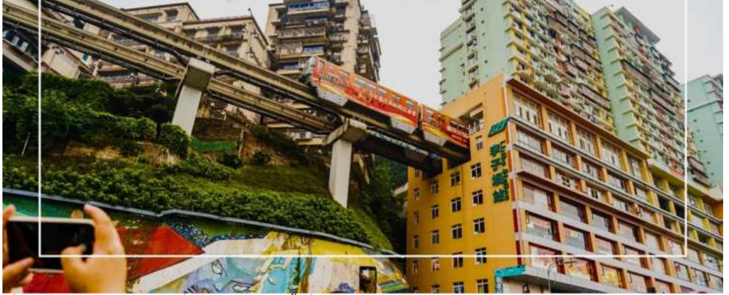
รถไฟฟ้าลัดราง สถานีลิซ่าป้า (Monorail train Liziba Station)