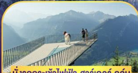
นั่งรถกระเช้าไฟฟ้า ชาร์เตอร์ คูสุม