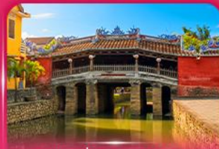
สะพานญี่ปุ่นโบราณ ฮอยอัน