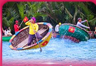
ส่องเรือกระดัง หมู่บ้านกิมทาน