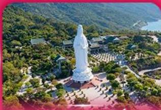
องค์กวนอิม วัดหลันอิ่ง