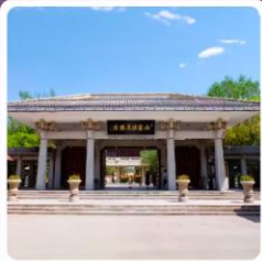
อุทยานประวัติศาสตร์จิ่วจ้วน