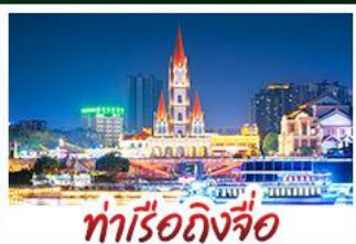
ท่าเรือกิ่งจื่อ

เขาชิงช้าสวนดอกไม้ตามฤดูกาล หมู่บ้านสไตล์ยุโรปเที่ยงวัน มังซิง เสี่ยวเจี้ยน ถนนคนเดิน NANNING ZHIYE - เมืองโบราณไท่ผิง ท่าเรือกิ่งจื่อ - ถนนคนเดิน สามตรอกสองซอย