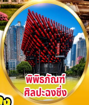
พิพิธภัณฑ์ ศิลปะฉงชิ่ง