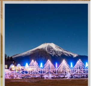
"YAMANAKAKO ILLUMINATION FANTASEUM"