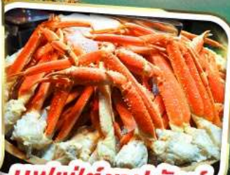
บุฟเฟ่ต์ซาปูยักษ์