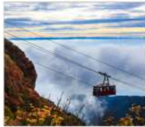
นั่งกระเช้าลอยฟ้าอุเนเซ็น