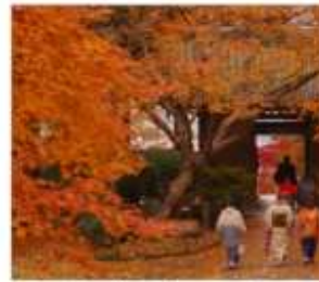
วัดไดโดเซนจิ