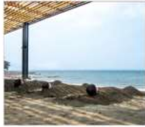
อามทรายร้อย