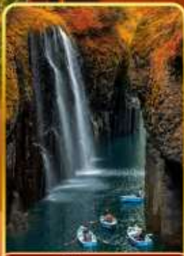
ทาคาจิโอะ(ไม่รวมสองเรือ)