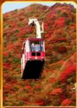
กระเช้าลอยฟ้าอุเซน