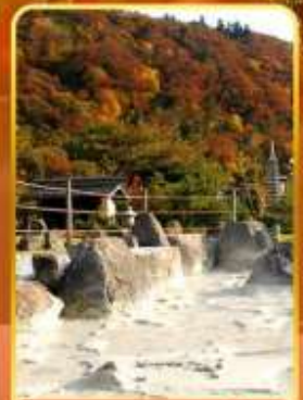
หุบเขานรกอุเซน