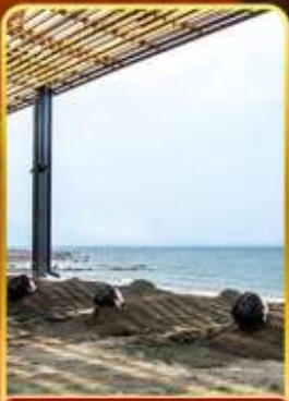
อาบน้ำร้อน