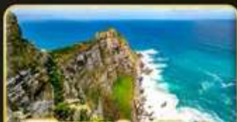
พิชิตแหลม Good Hope