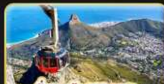
นั่งกระเช้า 360 องศา สู่ Table Mountain