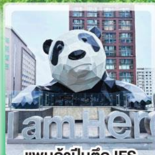
แพนด้าป็นตึก IFS