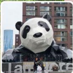
แพนด้าปิ่นตึก IFS