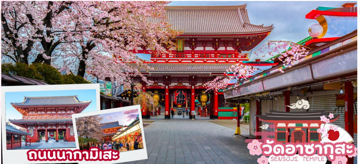
ถนนนากามิसे

พาท่านเดินสูริมแม่น้ำสุมิเดเพื่อ ชมซากุระ ที่ตั้งอยู่เรียงราย 2 ฝั่งริม แม่น้ำสุมิเด ซึ่งในช่วงฤดูใบไม้ผลิ ที่นี้จัดเป็นสถานที่อีกแห่งที่จัดได้ว่าเป็นอีกหนึ่งไฮไลน์ ที่คนญี่ปุ่นนิยมเดินทางมาถ่ายรูปเก็บภาพ บรรยากาศและเดินชมดอกซากุระ อิสระให้ท่านได้ถ่ายรูปเก็บภาพความประทับใจไปกับซากุระ และ หอคอยโตเกียวสกาย ทรี (Tokyo Sky tree) ที่เปิดเมื่อ 22 พฤษภาคม 2555 มีความสูง 634 เมตร (โดยปกติซากุระจะบานประมาณปลายกลางมีนาคมถึงต้นเดือนเมษายน อาจมีการเปลี่ยนแปลงได้ ขึ้นอยู่กับสภาพอากาศ)