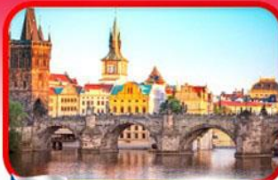
เขื่อนอินสะพานชาร์ลส์