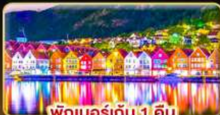
พักเบอร์เกน 1 คืน