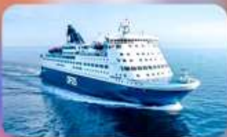
พักบนเรือสำราญ แบบ Window Room 1 คืน