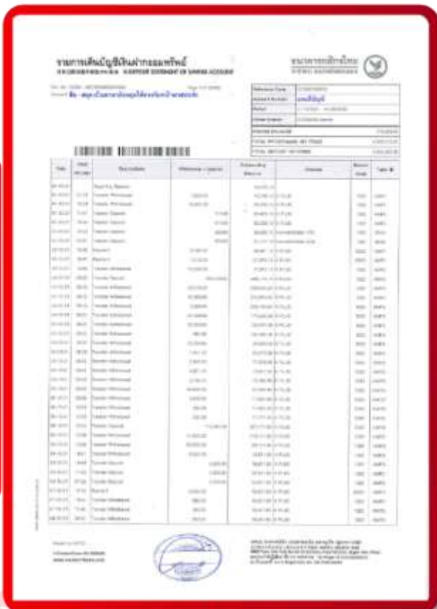
ตัวอย่าง Bank Statement ที่ผู้สมัครต้องยื่นกับธนาคาร

3.4 ปรับสมุดบัญชีธนาคารตัวจริง และเตรียมไปในวันที่ยื่นวีซ่า