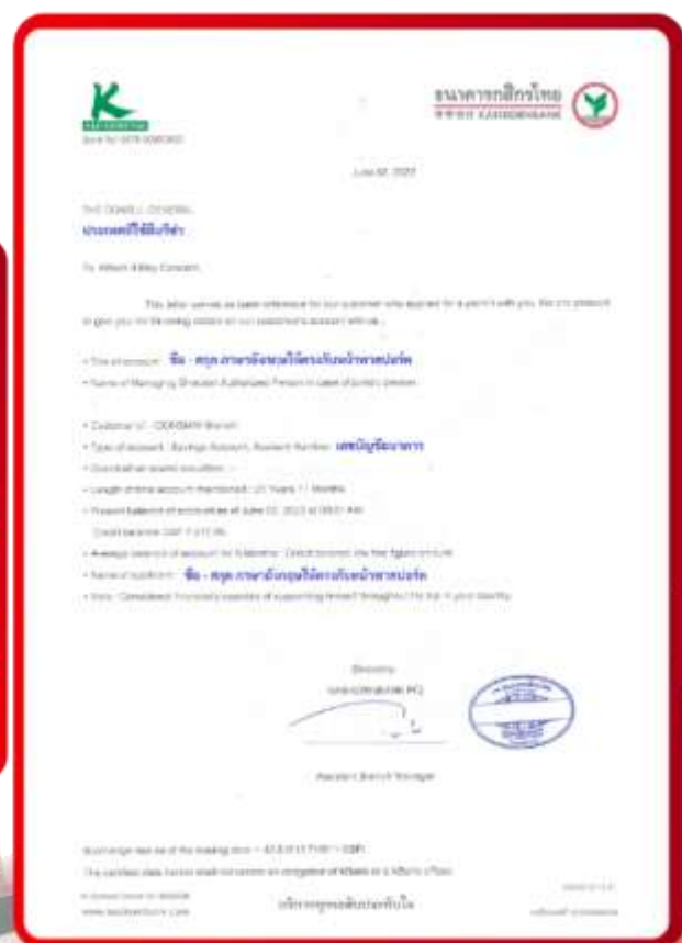
ตัวอย่าง Bank Guarantee ที่ผู้สมัครต้องยื่นกับธนาคาร