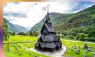
Unseen ไนท์ Borgund/Stave Church