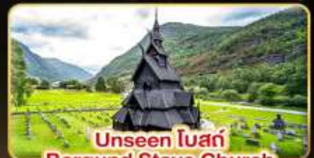
Unseen โบสถ์ Borgund Stave Church