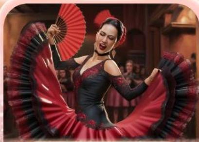
ระบำฟลามิงโก